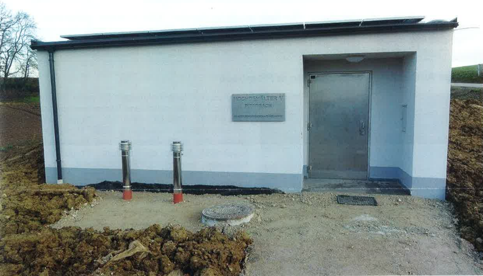
Neuer Hochbehälter V Piberbach